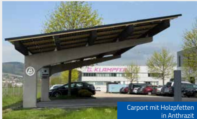
Carport mit Holzpfetten in Anthrazit