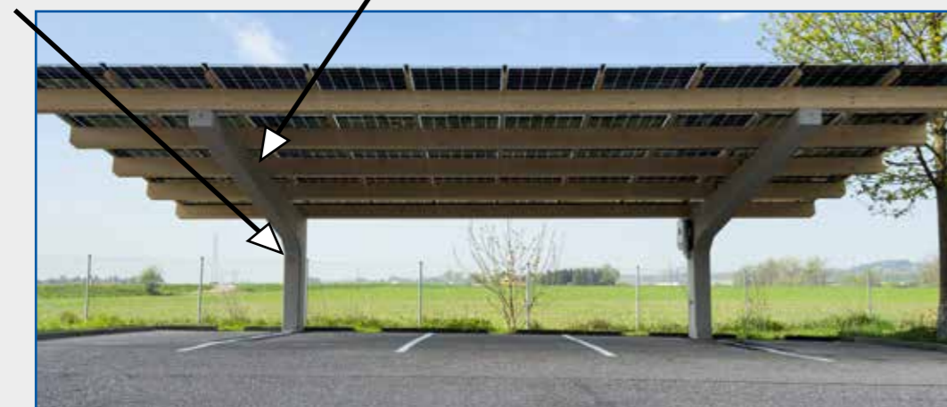
Bernegger Bodenverankerungssystem als Erdungssystem nutzbar.

Leerrohrverteiler je Element Integrierte Befestigungsschiene je Element