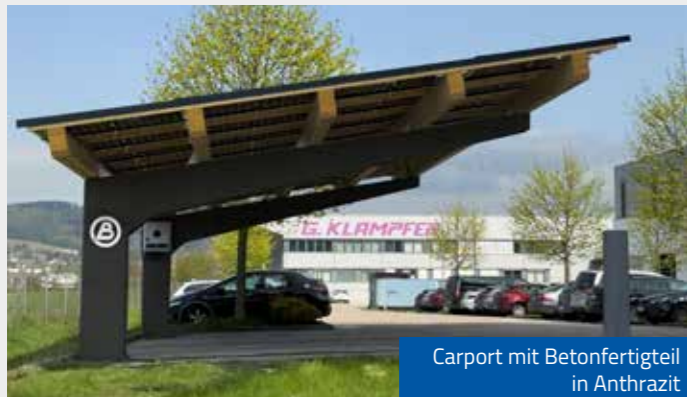
Carport mit Betonfertigteile in Anthrazit